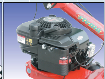
leicht startender 4-Takt Benzinmotor

levier de débrayage simple d'utilisation